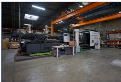
Inyectora termoplástico 1300 ton. Columna retráctil DEMAG Ergotech 1300-8000 Ref: 17923