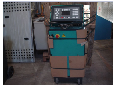
Sistema inyección de gas 350 Bar BAUER GI 120 5-5 Ref: 17930