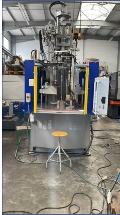
Inyectora termoplástico 110 ton vertical