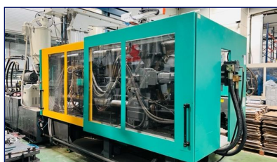
Inyectora termoplástico 460 ton

Ningbo Hengrun Plastic Machinery Co., Ltd Ref: ID-002