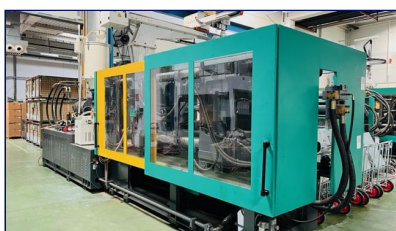
Inyectora termoplástico 460 ton

Les enviamos nuestro boletín de Octubre multisectorial, con entrega inmediata de los 21 productos ofertados. Todas las máquinas se entregan directamente desde su ubicación. Para mas detalles, pueden llamar al teléfono 936664932 o bien enviar un correo a info@cemausa.com , hacer sus compras en la web y también puede hacer sus consultas al WhatsApp 690 216 107.