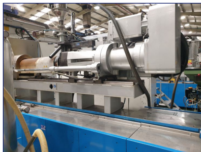
Inyectora termoplástico 550ton. Rápida NETSTAL EVOS 5500-2000 Ref: 17924