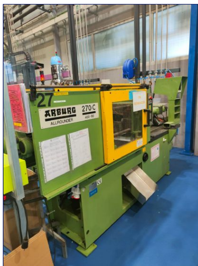
Inyectora termoplástico 40 ton. ARBURG Allrounder 270 C - 400 - 90 Ref: 17928