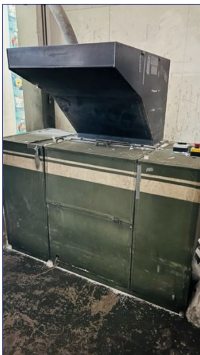
Molino universal 10 cv insonorizado MATEU&SOLE GRB 10 Ref: 17990