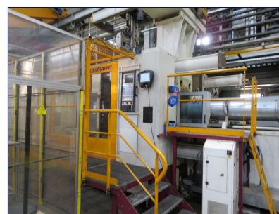
Inyectora termoplástico 1600 ton. Híbrida