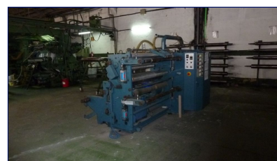
Rebobinadora cortadora film 1200 mm