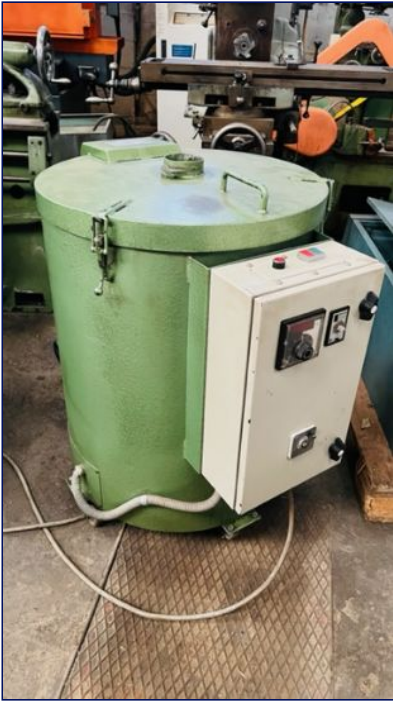
Turboestufa 50 litros. COMERCIAL MARSE CM-50