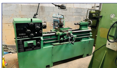
Torno cilíndrico 1150x390 m/m.