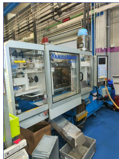
Inyectora termoplástico 80 ton. KRAUSS MAFFEI KM 80/160 C2 Ref: 17926