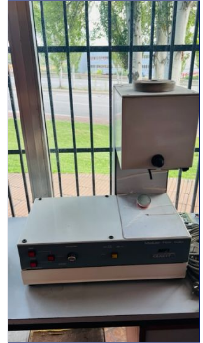
Indice de fluidez